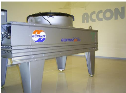
SchalleLeistungsbestimmung im Hallraum der ACCON GmbH in Greifenberg

Für eine komplette Produktreihe wurden die Schalleistungen der Zu- und Abluft sowie die Abluft-Richtcharakteristika ermittelt. Aus diesen Emissionsdaten wurden mit dem Rechenprogramm CadnaA unter Anwendung der Norm DIN ISO 9613-2 die Freifeld-Schalldruckpegelverteilungen für die Umgebung der Geräte berechnet. Die Ergebnisse sind in Form von farbigen Schalldruckpegelkarten über ein Auswahlprogramm der Hans Güntner GmbH abrufbar.